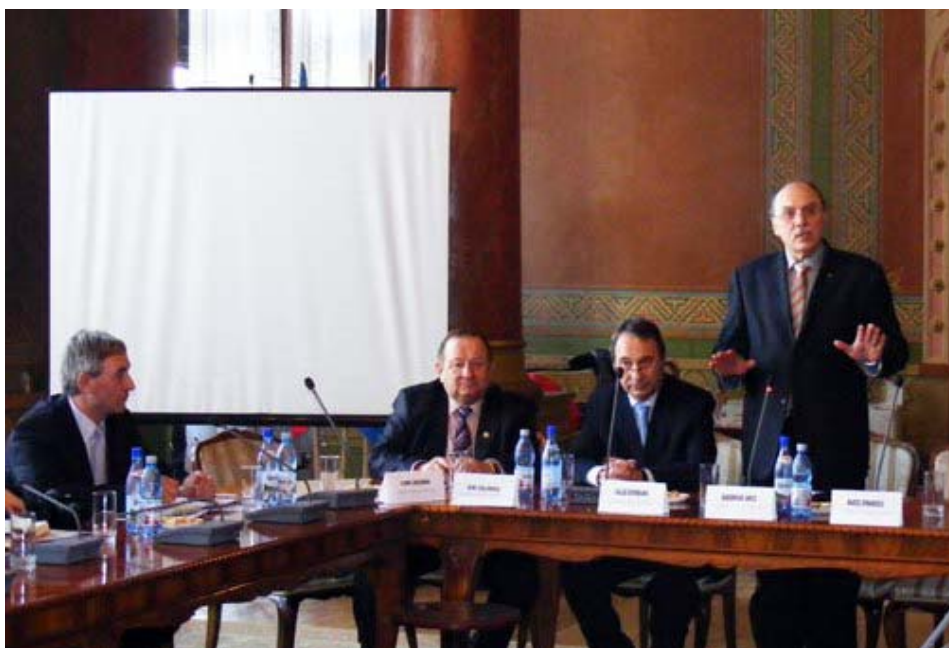
▲ Întrevederea prof.univ.dr. Gheorghe Iancu, Avocatul Poporului cu reprezentanții autorităților publice locale din județul Gorj, 22 februarie 2012

Întâlnirea a fost urmată de conferința de presă Un nou Avocat al Poporului – o nouă viziune. Colaborarea Avocatului Poporului cu Instituția Prefectului, Primăria, Consiliul Județean și autoritățile publice din județul Gorj.